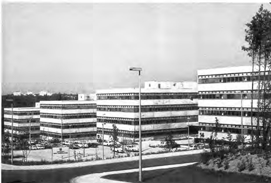
Das Bild zeigt einen Teil der bereits in Betrieb genommenen Universitätsbauten.

Der milde Winter ließ das Ungeziefer in diesem Jahr üppiger gedeihen als sonst. Deshalb ist es wichtig, gerade jetzt zu Beginn der Gartensaison die Gesundheit der Pflanzen zu erhalten. Besonders die Nadelgehölze sind nach diesem unnatürlichen Winter besonders pflegebedürftig. Im übrigen ist die Arbeit im Garten ein notwendiger Ausgleich für den berufstätigen Menschen, dem es in der Regel an Bewegung und frischer Luft mangelt, was er beides hier findet.