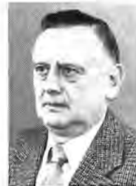
G. Gräber Karosserie Pkw 6.3.1975