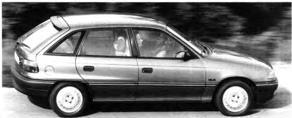
Angebot: Astra-Finanzierung zu günstigen Konditionen

Monatsraten und eine Schlusszahlung fällig. Ganz ohne Bargeld geht es übrigens nicht: Ein Viertel des Preises muß man anzahlen. Das Angebot gilt noch bis 30. April. flo