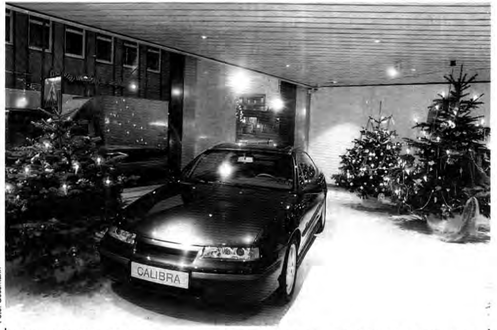
Die Redaktion Opel-Post wünscht allen Lesern ein frohes Weihnachtsfest und ein gutes neues Jahr. Das Bild entstand im Ausstellungsraum in Rüsselsheim.

und Betriebsrat die jüngsten Gewalttaten verurteilt. Und sie haben harte Konsequenzen für den Fall angekündigt, sollten Aktionen dieser Art vor den Werkstoren nicht halt machen. Auch die Situation draußen läßt das Unternehmen nicht kalt: Als Zeichen der Solidarität wurden insgesamt 150 000 Mark zur Ergreifung der Mörder von Mölln und zur Soforthilfe für die Opfer bereitgestellt. Diese Meldung war der englischen „Financial Times“ ein Aufmacher wert – so stark beobachtet uns mittlerweile das Ausland. „Wir sind ein Team“ – nicht nur die Weihnachtszeit gibt diesem Satz einen ganz neuen Sinn.