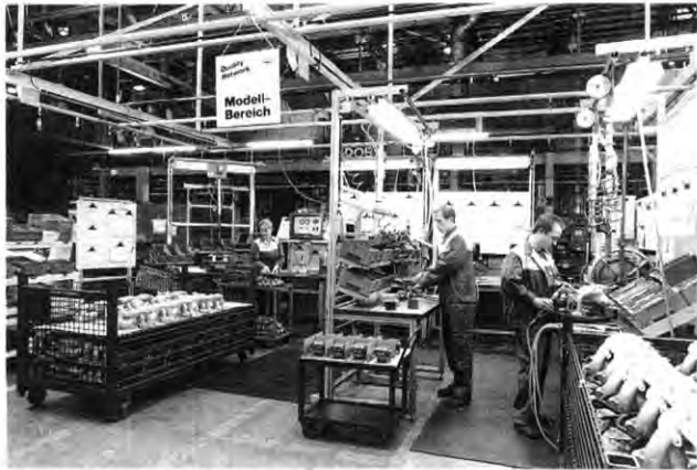
Modellbereich: Das Förderband hat hier ausgedient

Von den positiven Erfahrungen aus der Krümmer-Montage sollen künftig noch mehr Kaiserslauterer Opel-Mitarbeiter profitieren. Im Preßwerk und im Bereich der Antriebswellen-Fertigung entstanden bereits weitere Modellbereiche. cv