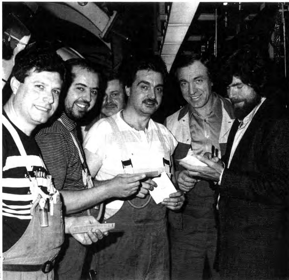
Fußmarsch: Reinhold Messner besuchte Fans in der Produktion

Rüsselsheim. Haben Sie vom 18. bis 20. Dezember schon etwas vor? Wenn nicht, können Sie sich noch bis Freitag, 11. Dezember, bei der Abteilung Innerbetriebliche Kommunikation, Telefon 3387, zu einer Fahrt nach Nürnberg anmelden. Geplant sind der Besuch des Christkindmarktes und des Würzburger Weihnachtsmarktes. il