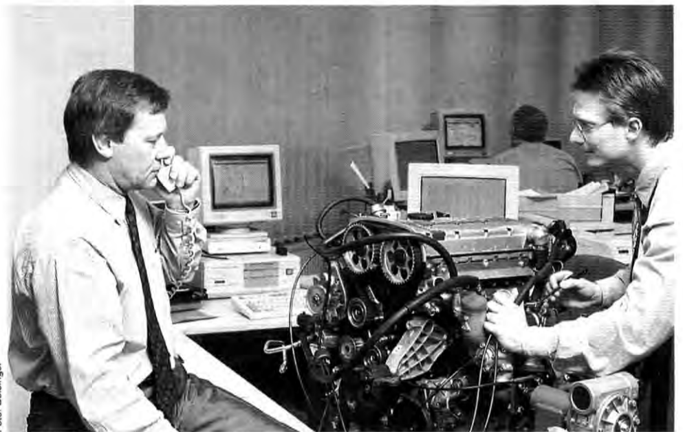
Service: Bei Anruf Rat

Die kommt in aller Regel schnell, indem das Problem lokalisiert und dann gemeinsam gelöst wird. In Sonderfällen werden auch spezielle Teile dem Händler zum Einbau zugestellt, um wirksam Abhilfe zu schaffen. Dabei kommt dem gesammelten Datenbestand eine doppelte Bedeutung zu. Wird ein technisches Problem öfters angesprochen, werden die Mitarbeiter des Servicecenter besonders hellhörig. Dann wandert der Fall auf den Schreibtisch des zuständigen TEZ-Ingenieurs und es fließt möglichst bald eine Änderung in die Serie. Zum anderen ist die Sache „aktenkundig“ und kann in späteren Garantie- oder Kulanzfällen herangezogen werden.