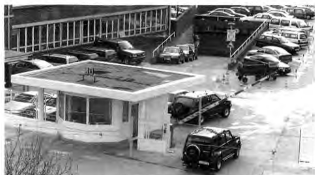
Ergebnis: Frische Farbe dank Quality Network