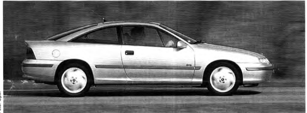
Sieger: „sport auto“-Leser wählten den Calibra Turbo zum sportlichsten Auto