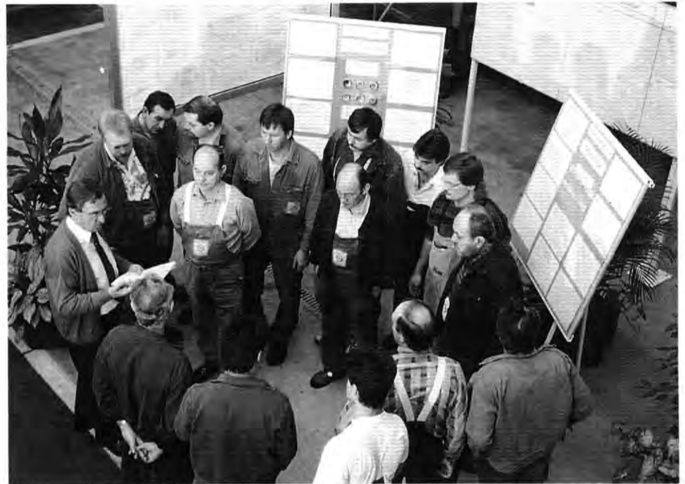
Treffpunkt „Oase“: Drei-Minuten-Treff bei Schichtbeginn im Werk Bochum 2

QNPS lebt vom Mitmachen: Opel setzt vor allem auf die Erfahrungen und den Ideenreichtum seiner Mitarbeiter, um Arbeits- und Produktionsabläufe zu optimieren. Der Fortschritt, der auf diese Weise erzielt wird, ist in Rüsselsheim, Bochum und Kaiserslautern bereits sichtbar. Hier haben Mitarbeiter und Werksleitung Modellbereiche eingerichtet, die als Einstieg in das neue Produktionssystem die-