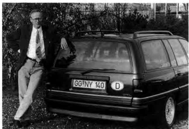
Bühnenreif: Schauspieler Luger mit seinem Omega 2.6i