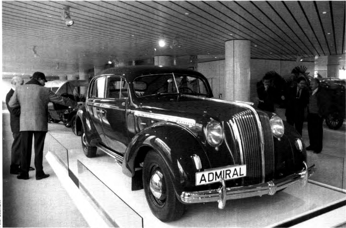
Spätheimkehrer: Restaurierter Admiral im Opel-Forum